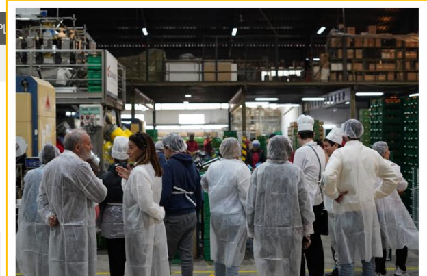
COFRUDECA mostró las instalaciones y el proceso de confección de la fruta.